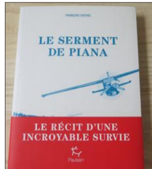
Déjà présent en 2014, avec "Sous les ailes de l'hippocampe", François Suchel est de retour au festival.